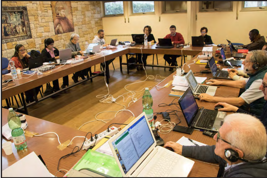
Reunión de la Presidencia del CIOFS Primavera de 2017