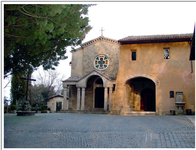
La ermita de Fonte Colombo donde San Francisco escribió la Regla de 1223

Después de esto, según Tomás de Celano, “Bernardo cumplió inmediatamente todas estas cosas, sin descuidar ni un ápice de este consejo. En poco tiempo, muchos se alejaron de las fatigas del mundo hacia un Bien infinito, regresando a su patria con Francisco como guía”. (El Recuerdo del Deseo de un Alma, Second Life, Capítulo X, 15.)