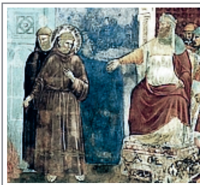
Giotto, St. Francis Before the Sultan

¿Recuerdas la Oración por la Paz? "Donde haya odio, siembre yo amor. Donde haya injuria, perdón, donde haya duda, fe... porque es muriendo (por ejemplo, a uno mismo) como nacemos a la vida eterna." ¿Realmente pensamos lo que rezamos y vivimos en consecuencia a ello?