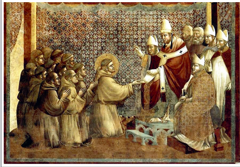
“La Confirmación de la Regla” by Giotto, 1297-1300, Assisi

Este año 2023, la Familia Franciscana conmemorará los 800 años de la confirmación de la Regla Posterior. También conocida como la Regla Aprobada, o la Regla de 1223, la aprobación papal de la regla marca la culminación de un largo y difícil camino para San Francisco. Su camino puede ser un ejemplo para los que hemos profesado una regla diferente, la Regla de la Orden Franciscana Seglar.